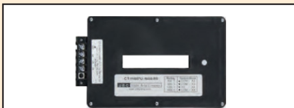
Unidad CT por fase para disyuntor tipo DS, 1.600/800 A