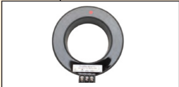
UNIDAD típica CT POR FASE de 1.600/800 A