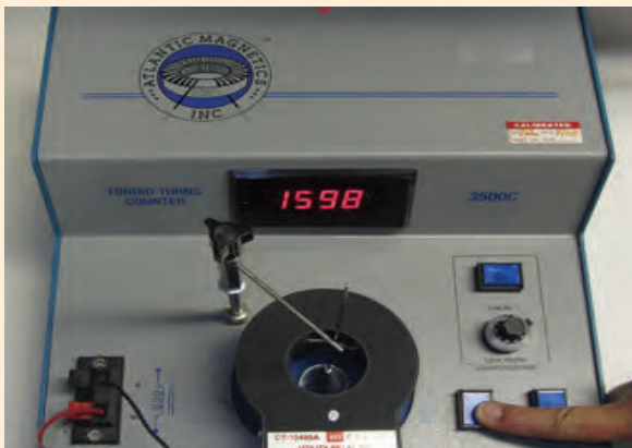
Comprobación del medidor de ocurrencias en unidades CT